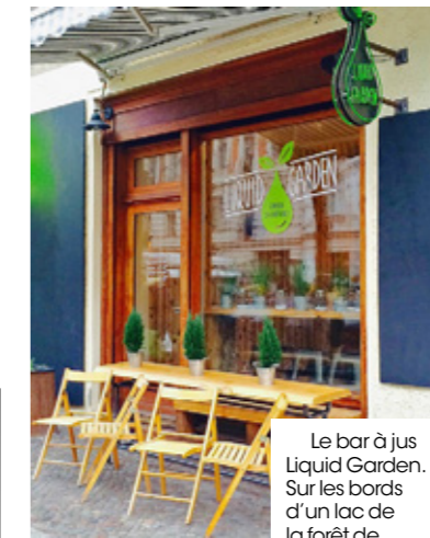
Le bar à jus Liquid Garden. Sur les bords d'un lac de la forêt de Grunewald, le restaurant Fischerhütte am Schlachtensee.

« Impossible de vivre à Berlin sans faire de yoga! Désormais, c'est comme à New York, toutes les filles