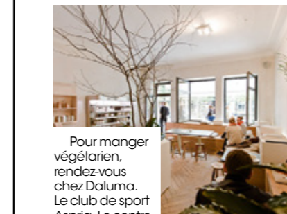
Pour manger végétarien, rendez-vous chez Daluma. Le club de sport Aspria. Le centre d'éducation à l'environnement Ökowerk initie les enfants à la nature.