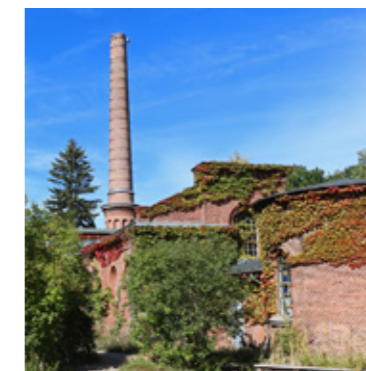
PAR MARIE LÉTANG-HORAY

se promènent avec leurs tapis sous le bras. La seule chose un peu difficile pour moi : les cours sont en allemand, donc je ne comprends pas toujours tout! »