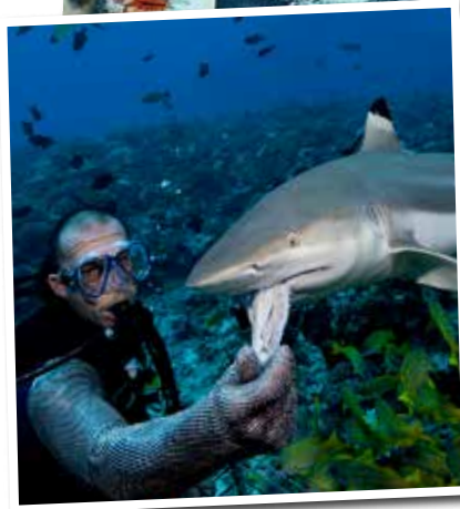
Le requin, le nouveau meilleur ami de l'homme. Si, si, on vous jure !

ponsable d'une dizaine de morts par an, contre 800 000 décès causés par le moustique », ajoute Robert Calcagno. Conjurer la peur et faire un sort au mauvais sort, c'est la bonne idée qu'a eu l'hôtel Maïa aux Seychelles en proposant à ses clients d'adopter un requin-baleine. Pas pour le voir s'ébrouer dans sa baignoire, mais pour le tracer et le protéger. Concrètement ? On commence par observer le seigneur des mers depuis un hélicoptère, puis on plonge à ses côtés pour lui implanter une puce GPS qui permettra de suivre sa trace durant 18 mois. Résultat ? Grosse émotion contre petite contribution financière, au profit d'une association de protection des requins. Car oui, les spécialistes déplorent plus de 50 millions de requins chassés et pêchés par an. Alors, prêt à adopter un nouveau compagnon en 2013 ? ■