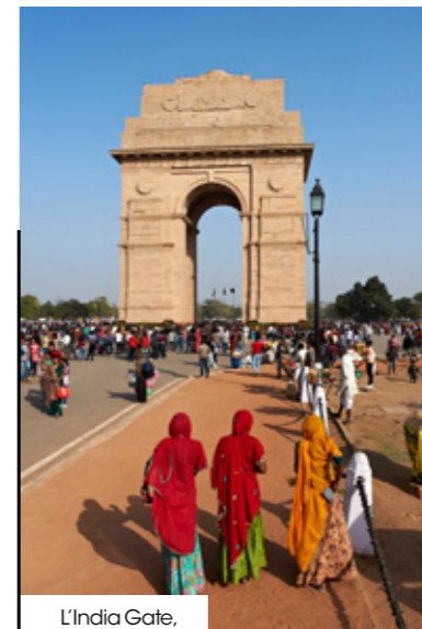
L'India Gate, à New Delhi (ci-dessus) et le Taj Rambagh Palace, à Jaipur (ci-dessous).

2nd Floor, KK Square, C11 Prithviraj Road, C Scheme, Ashok Nagar. www.anokhicafe.com