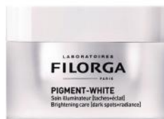
Pigment-White, 55,90 €, Filorga.

Il y a quelques années encore, seules les Asiatiques étaient accros aux soins éclaircissants, capables de les rapprocher de ce teint de geisha tant recherché. Aujourd'hui, les Occidentales les ont adoptés pour lutter contre les taches pigmentaires. Plus qu'un shot d'éclat, ce soin « médicosmétique » gorgé d'actifs pointus corrige les imperfections, rétablit l'uniformité de la peau et lisse la surface de l'épiderme pour un teint extrêmement lumineux.