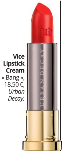
Vice Lipstick Cream « Bang », 18,50 €, Urban Decay.